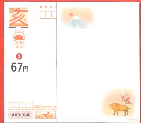
3 絵入り[寄附金付]全国版「いのしし」 *寄附金額は1枚につき5円です。