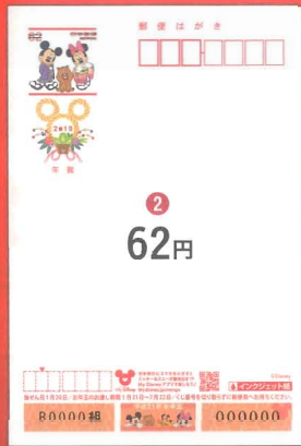
© Disney 2 ディズニー 年賀(インクジェット紙) *うら面は無地です。